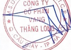
Đinh Tiến Thành