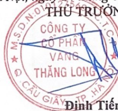
Đinh Tiến Thành