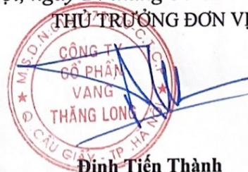
Đinh Tiến Thành